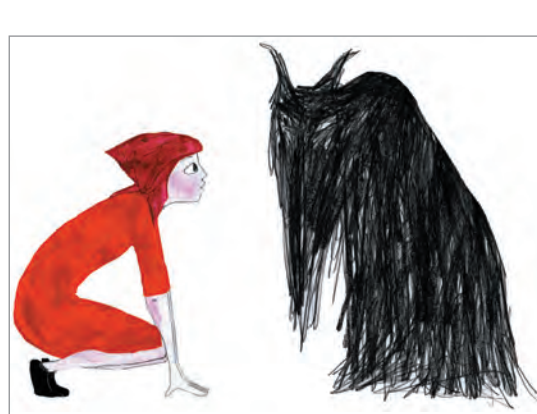
De 1 à 5 : © Marjolaine Leray